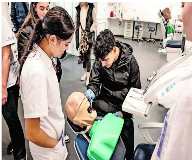
Op de open avond van ROC Midden Nederland in Utrecht maken scholieren kennis met de opleiding tot tandartsassistent.