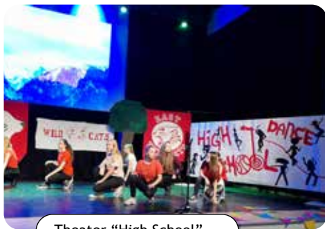
Theater "High School"