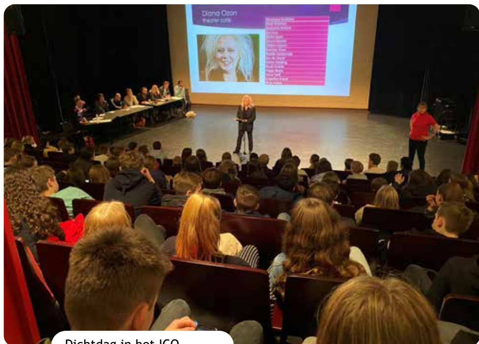
Dichtdag in het ICO