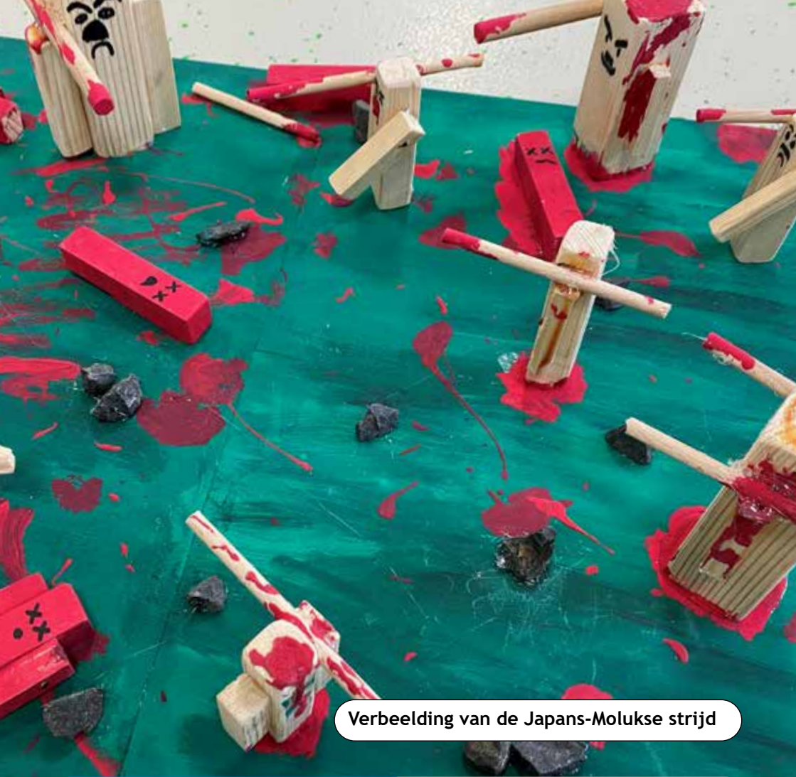
Verbeelding van de Japans-Molukse strijd