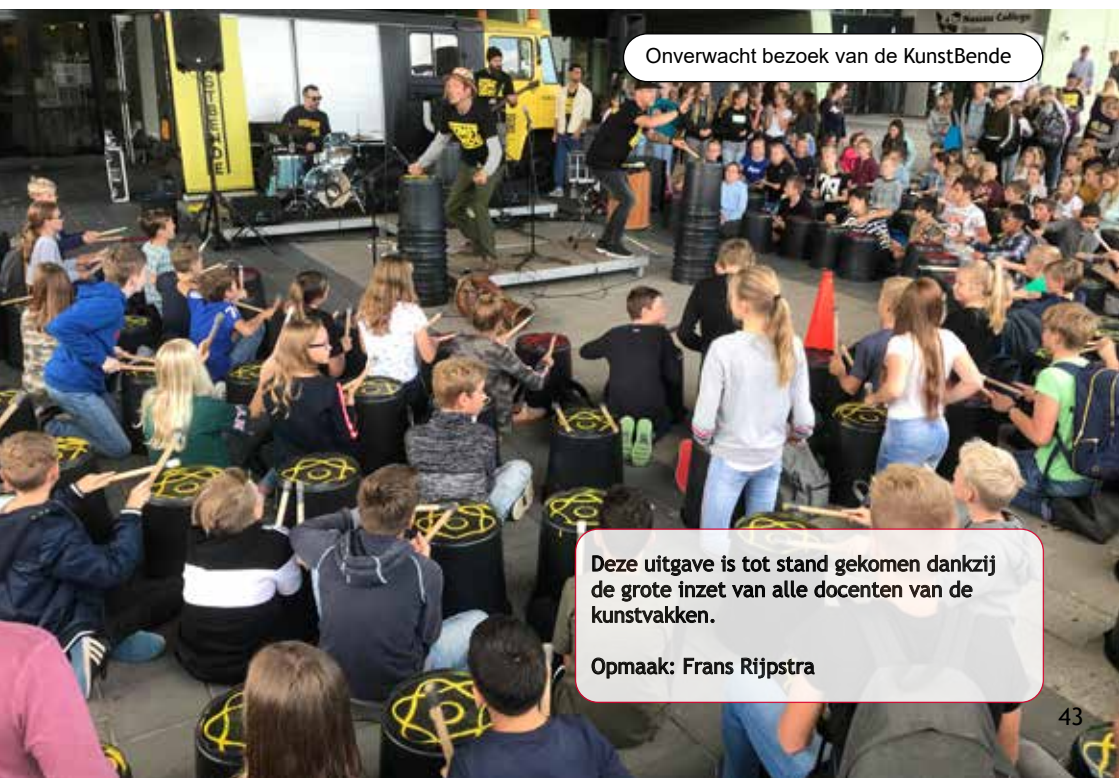
Onverwacht bezoek van de KunstBende

Deze uitgave is tot stand gekomen dankzij de grote inzet van alle docenten van de kunstvakken.