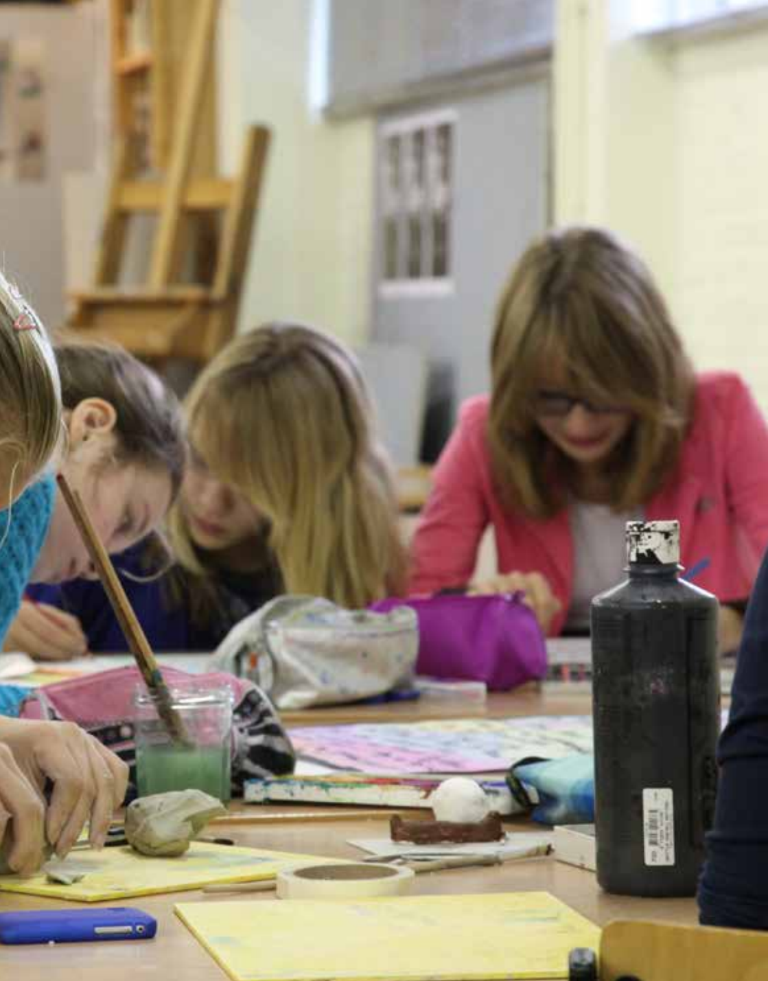
Leerlingen van gym-1 werken aan de Trojaanse oorlog