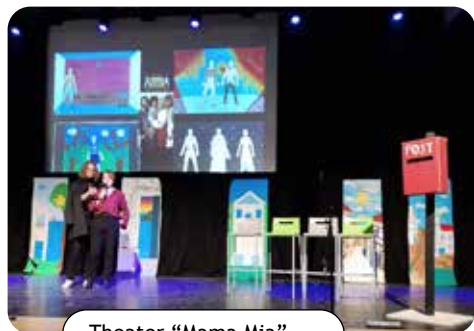
Theater "Mama Mia"