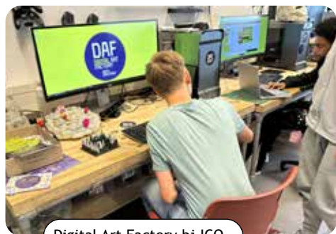
Digital Art Factory bj ICO