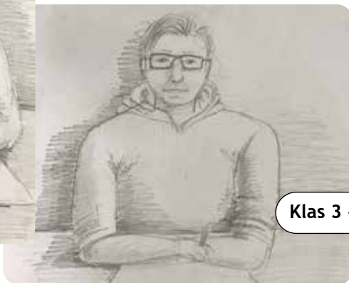
Klas 3 - Portret