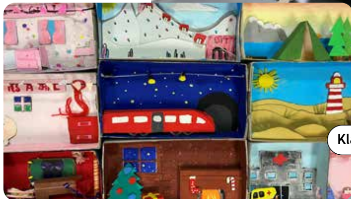
Klas 1 - Stilleven in 3D