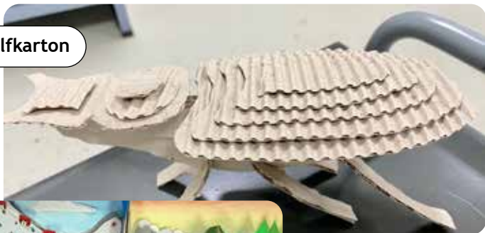
Klas 4 - Insect van golfkarton