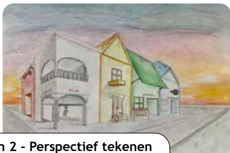
Klas 1 en 2 - Perspectief tekenen als een van de basistechnieken